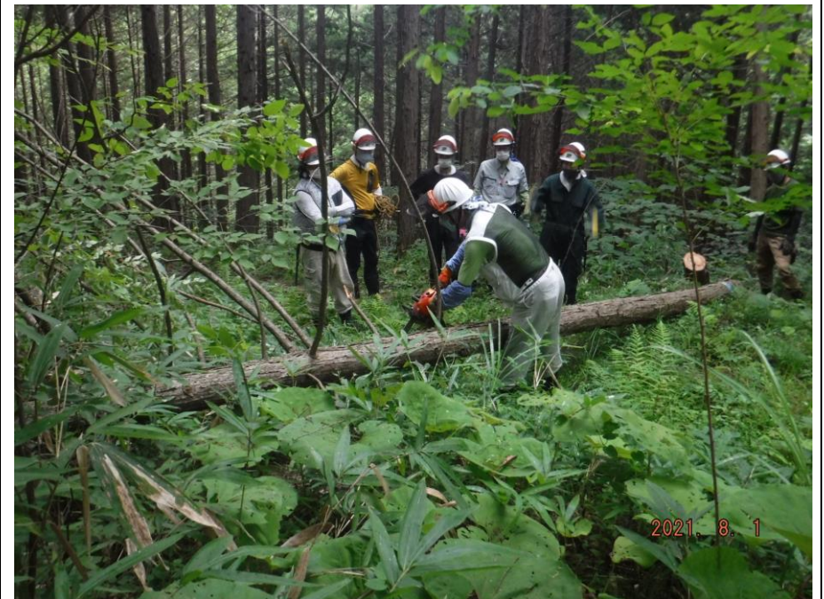
枝払いも一緒に学びます