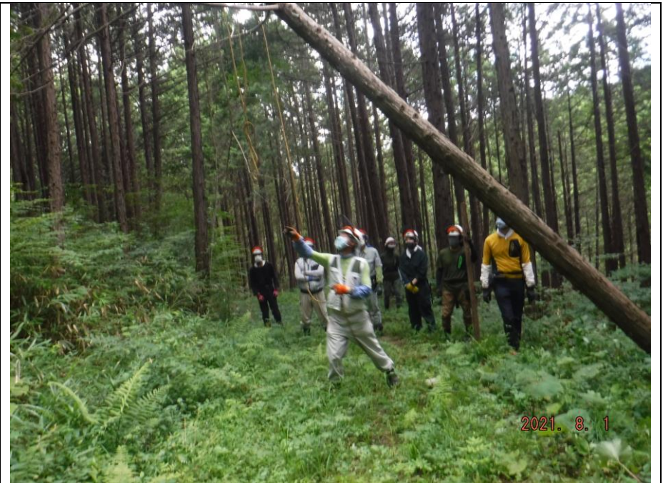
作業者に向かわないように安全ステーを張ります