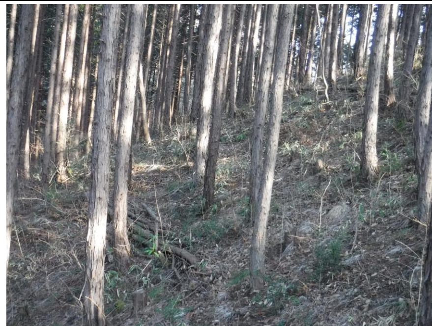
我々の手で集積された林内