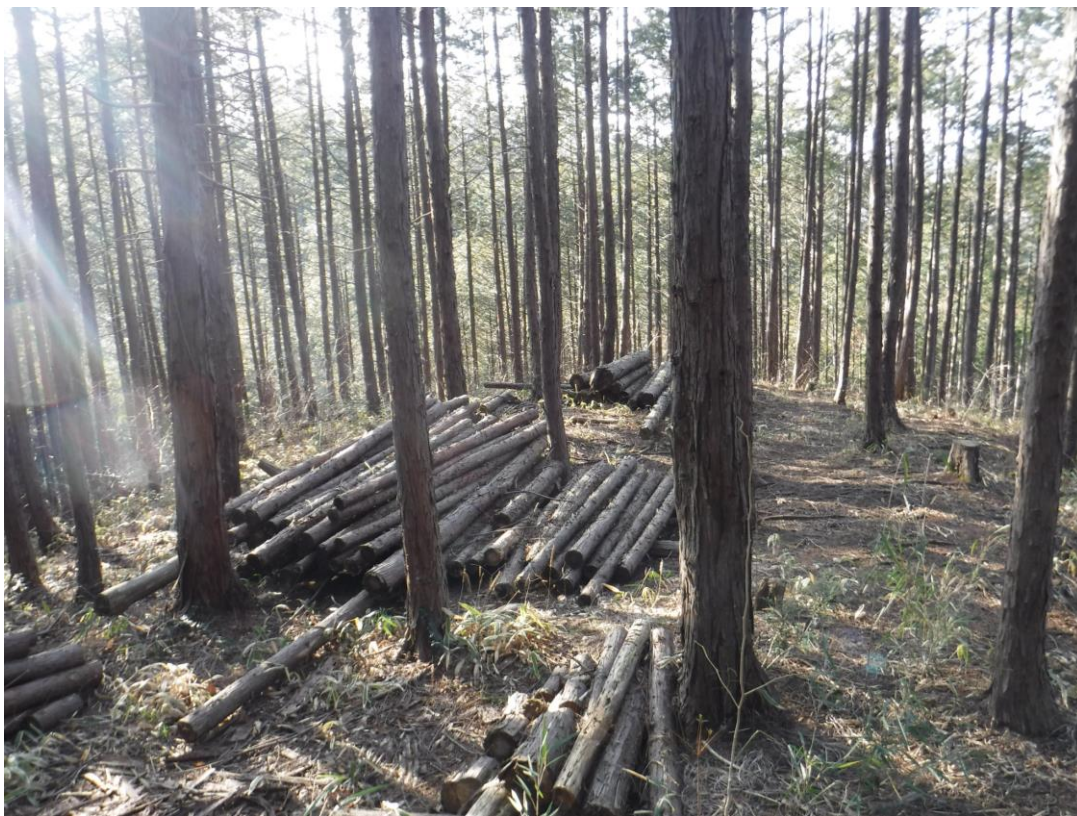
集積したが林地残材となってしまった

使ってもらおうと集積してみたが、林地残材となってしまったヒノキ。少量では販売ルートに乗せるわけにもいかず、先は見越せてはいたが、時間だけが過ぎ去り、有効利用の妙案は浮かばなかった。少量であればほしい人もいないか、需要の掘り起こしを考えないと。