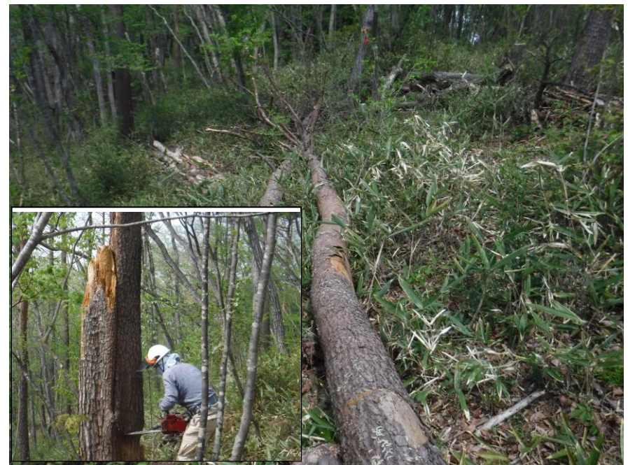
↑ 太くて両側から突っ込み切り ↑ 1本目と枕を並べる2本目