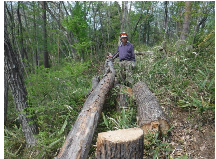
3本目の伐倒を終えて。1本目の上に3本目があります