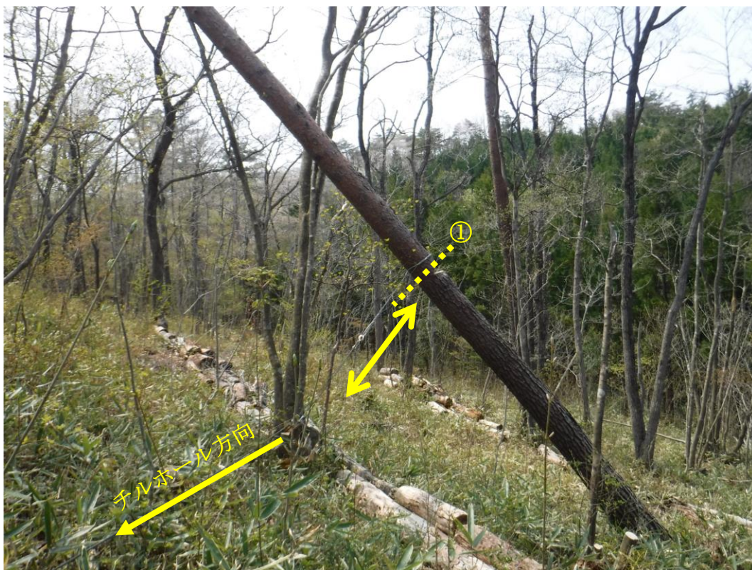
チルホールを離れた安全な場所にセットする

チルホールを併用した元玉切りです。準備と撤収に時間はかかりますが、比較的安全に処理できます。絶対的注意点は受けと追い口はセッティングの最後の工程とし、浅めにする事です。間違っても深く入れては危険です。