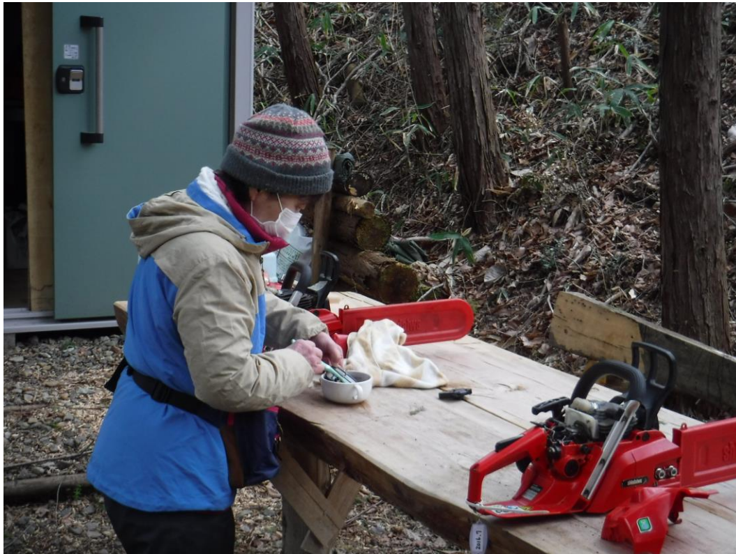
ガソリンに漬けて刷毛で汚れを落とす

刷毛でブラッシングしましたが、だめで、ガソリンで洗い落しました。乾燥後に口に当てて回復具合を確認。OK。