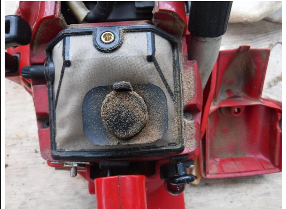
カバーを外すと驚きの光景が。絶句しかない。