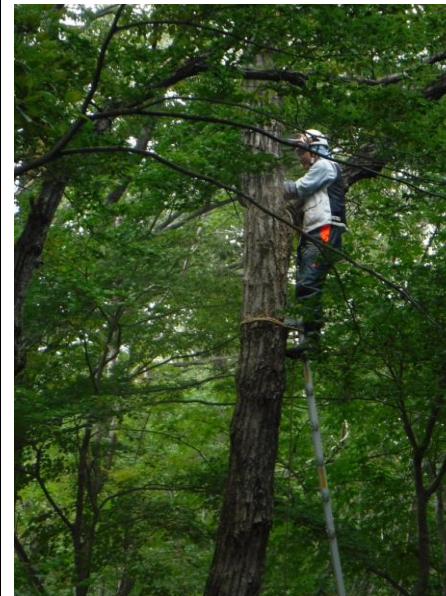
安全帯を装着して樹上の作業