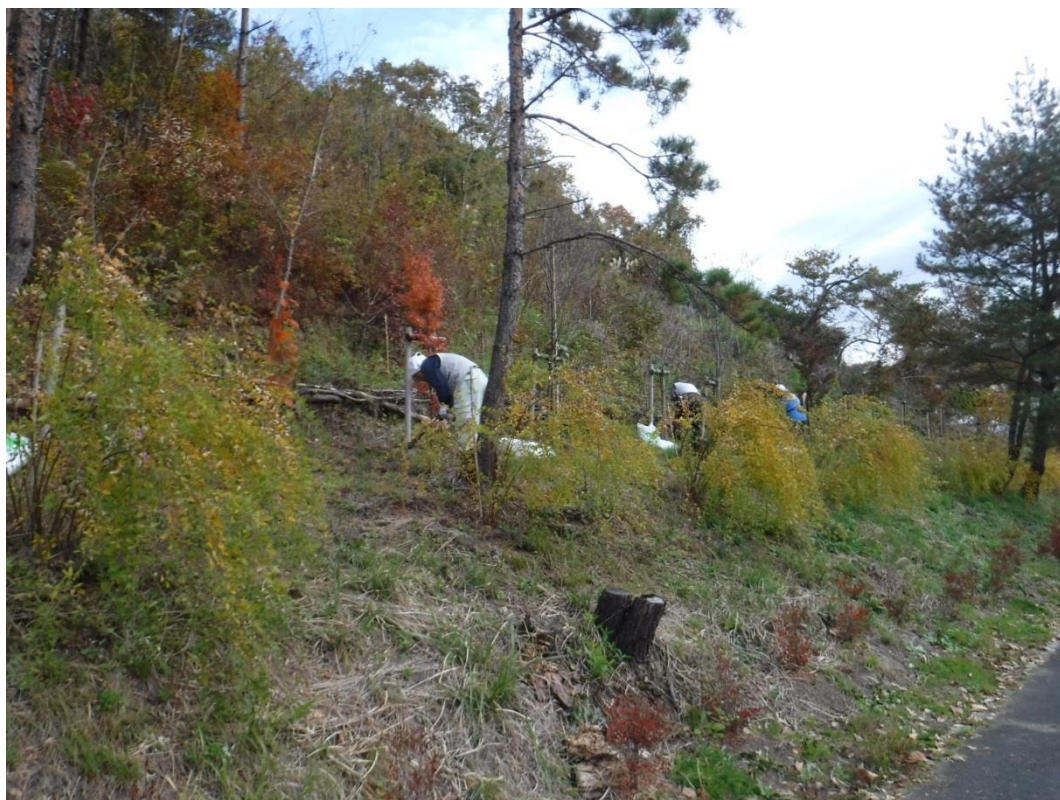
手前のミヤギノハギが黄色く紅葉している