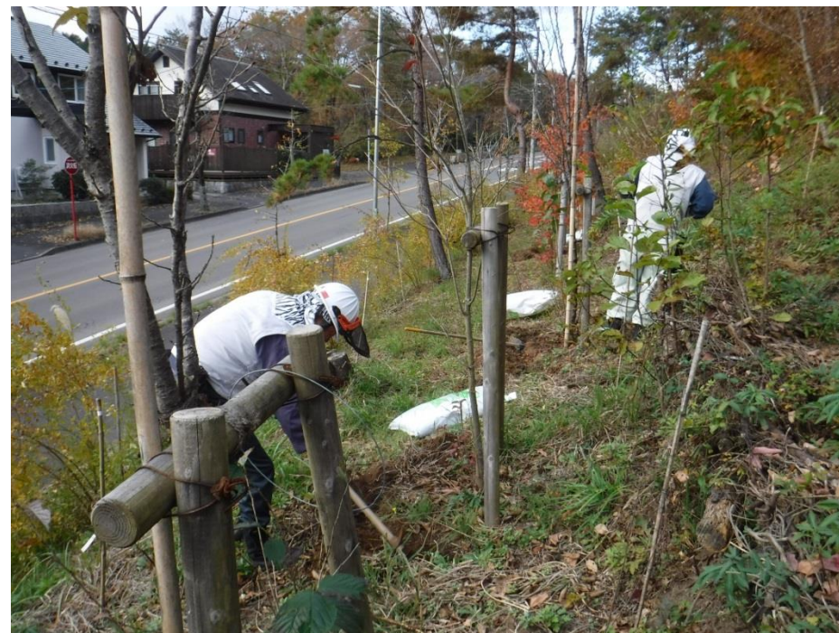
根の外周を掘ります