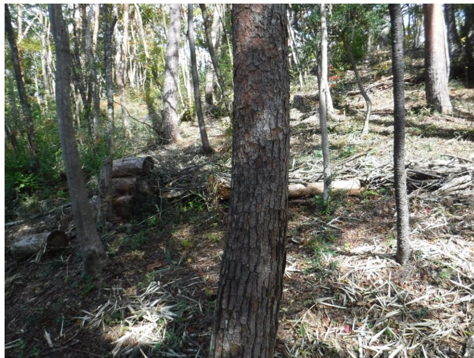
直射日光が林床に降り注ぐ