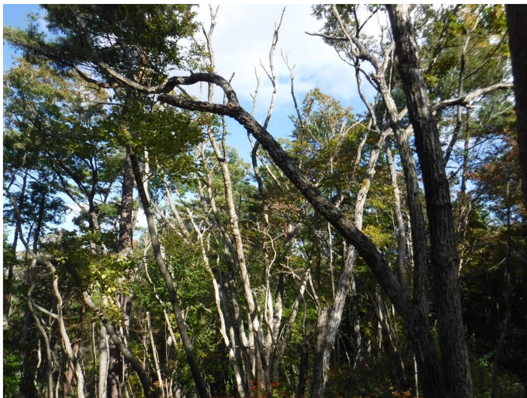
ナラ枯れで出現した上層空間