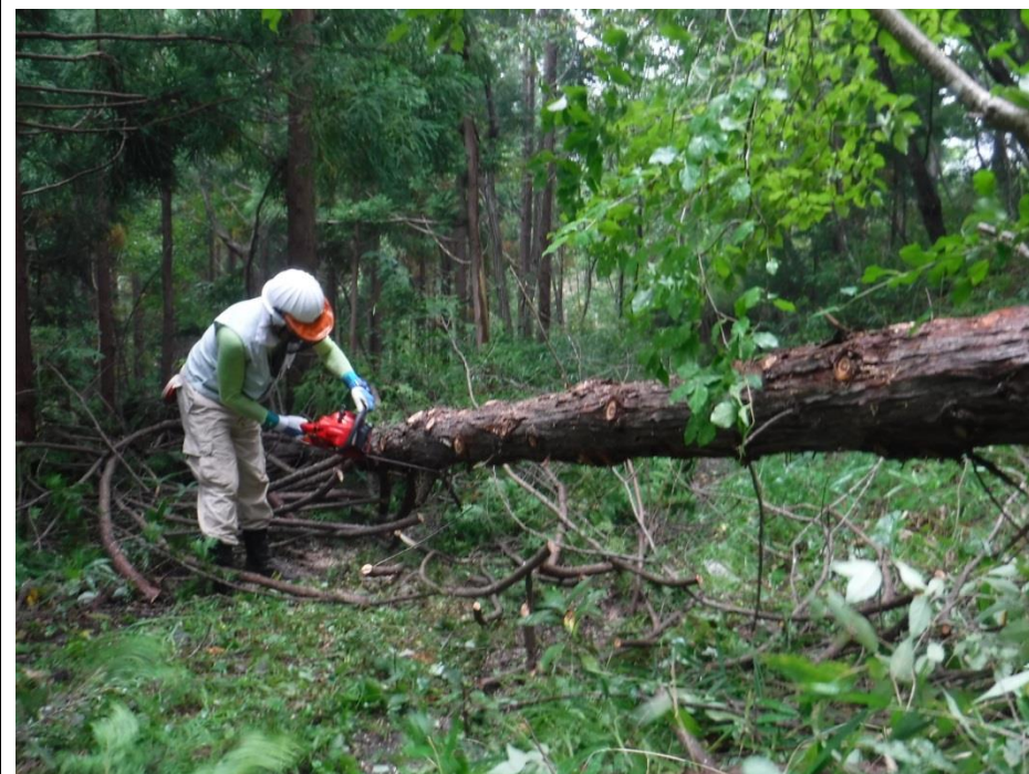
重量物なので枝払いも慎重に