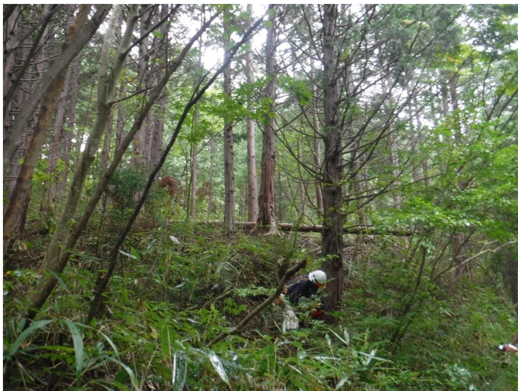
慎重に受け口を切り込みます

普段、クサビを使い慣れていないので、クサビの打ち込み時に、手元ばかりに目が行き、木の動きから目が離れる事に注意しました。いかに冷静に作業を進められるかがポイント。