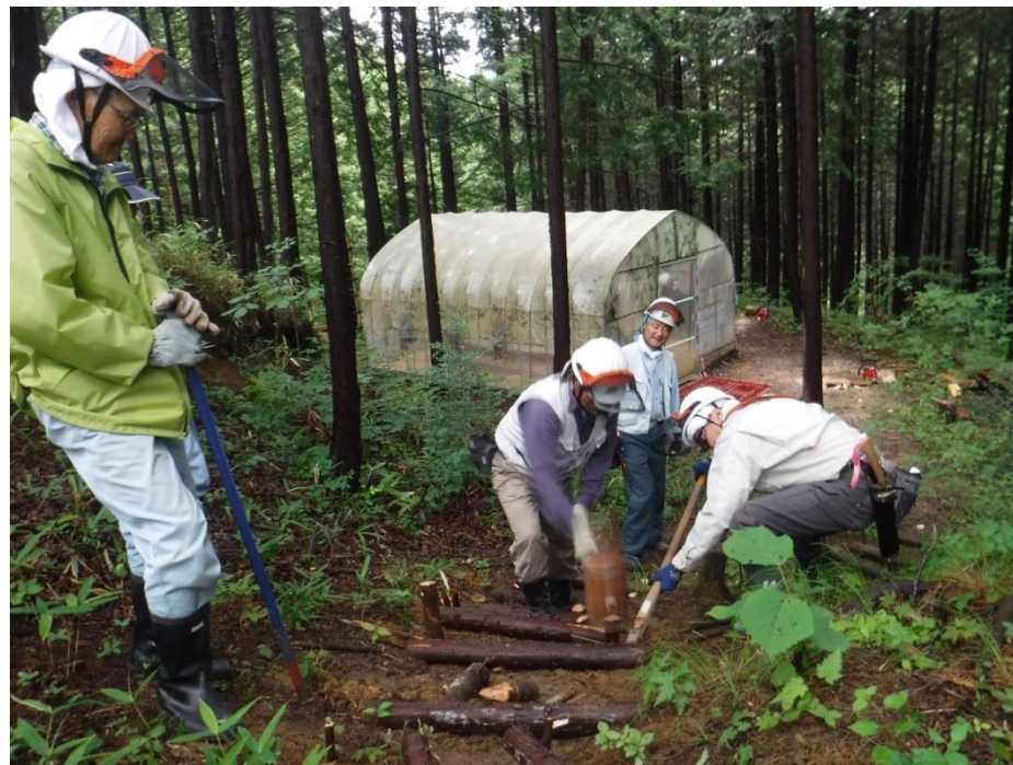
カケヤの使い方も納得してきたようです