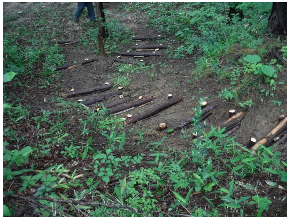
美しい仕上がりではないですか！満足、満足