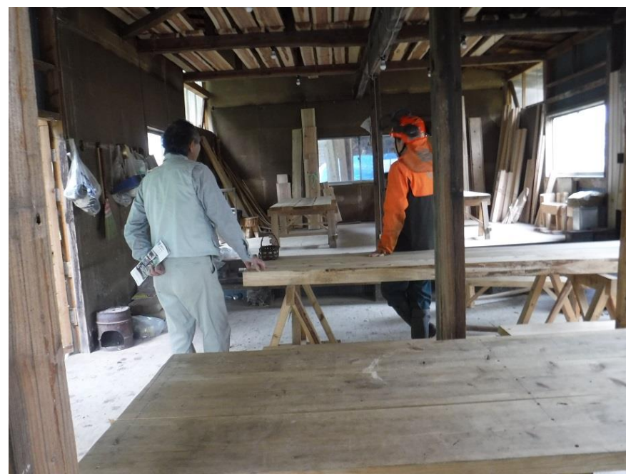
間伐材を製材して乾燥し（天井部）、それを使って工作できる