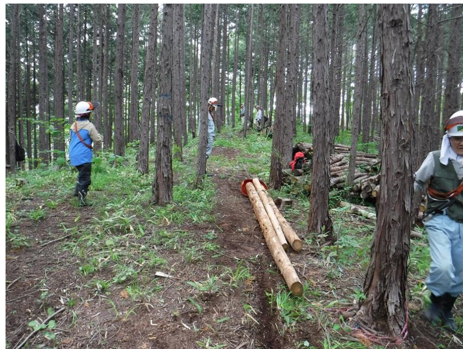
奥から林道までヒッパリダコで出します