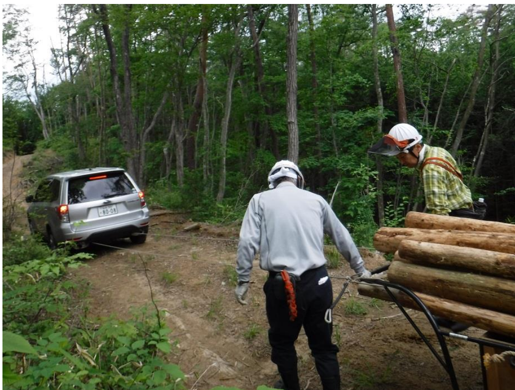
いざ牽引です。車に追突しないように、後ろにはブレーキ役が付きます

次回は車搬の方法を工夫してもう少し効率を上げたいと意欲がわいてきました。軽トラがあればそれだけですが、無い無いづくしで工夫するから面白い。馬搬は非現実的です。