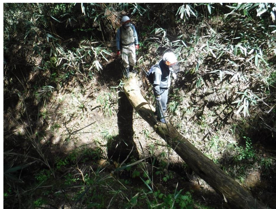
倒木で自然に出来た丸太橋を渡ります。緊張！