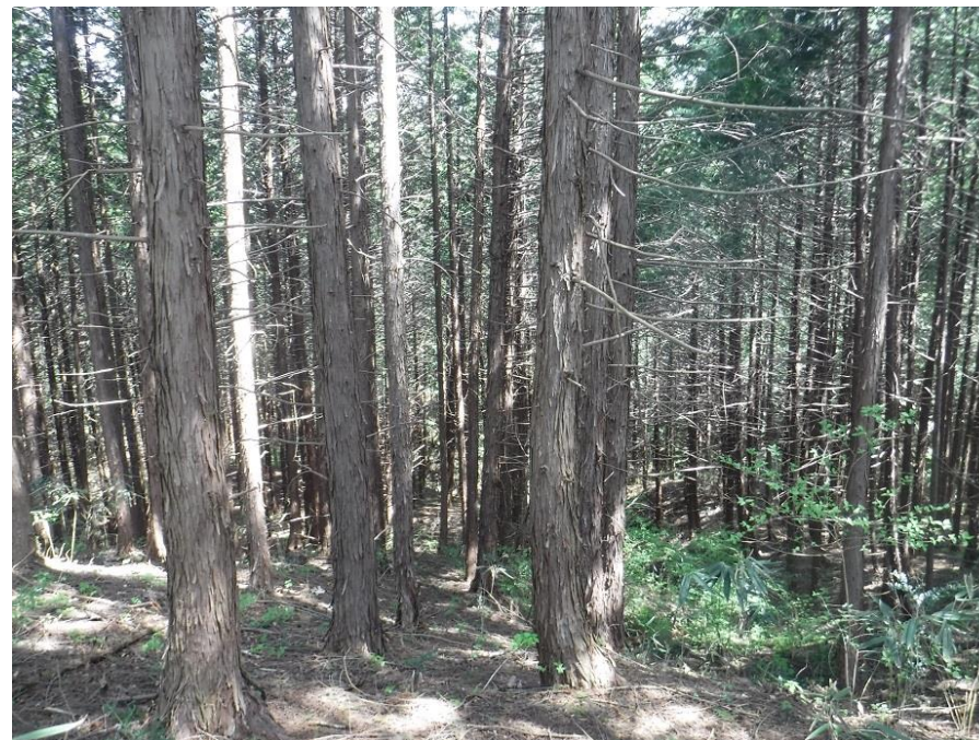
予想通り、林内は表土がむき出しです