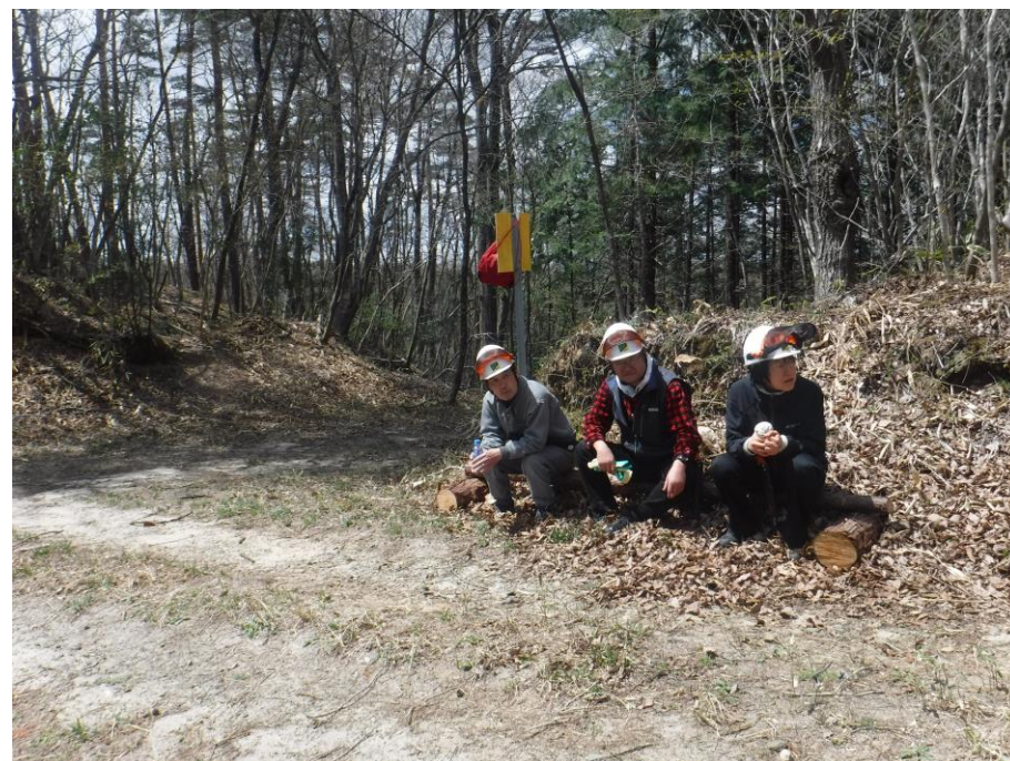
これから1年、整備の責任を負う勇姿3人