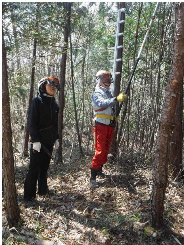
高枝打ち刀の使い方指南

会はサポートに徹して、先走りしないように気を付けます。枝打ち(枯れ枝)から始めて、間伐まで、約1年の予定で仕上げます。面積は2,000㎡です。