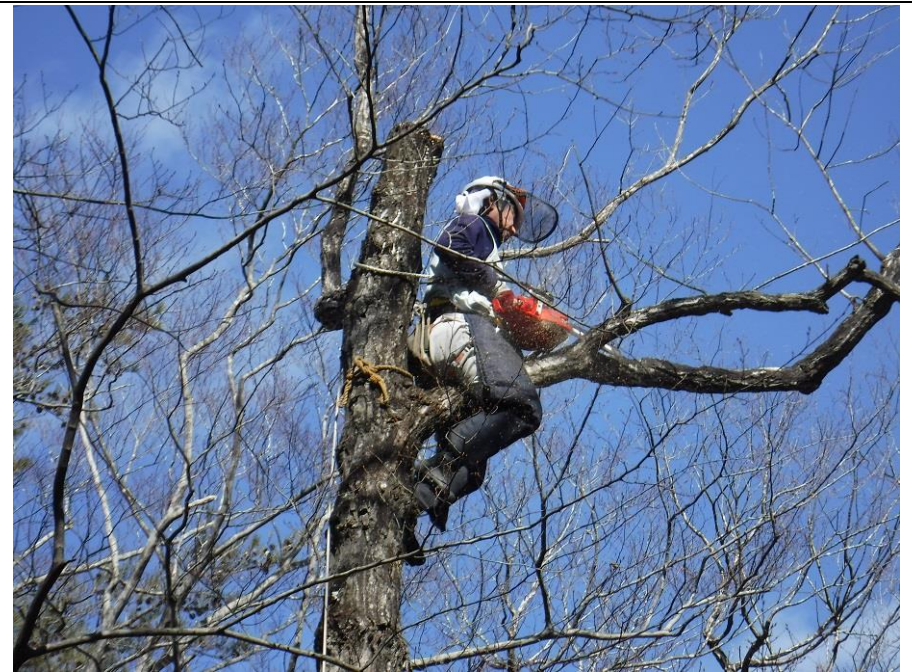
安全帯とロープでの確保、2重の落下防止対策