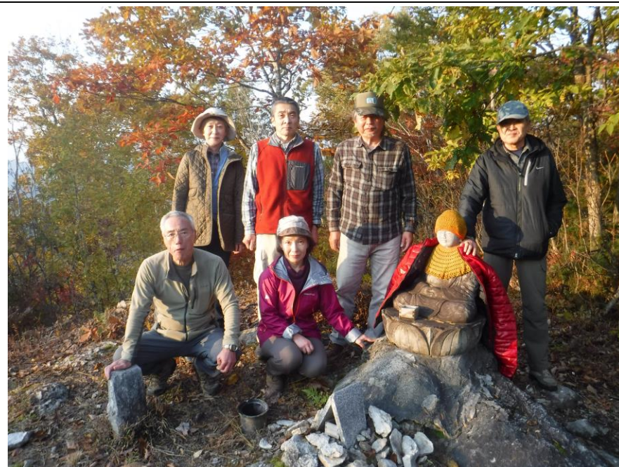
大仏山山頂。きのこに引かれ、4時過ぎ山頂で、急ぎ下山