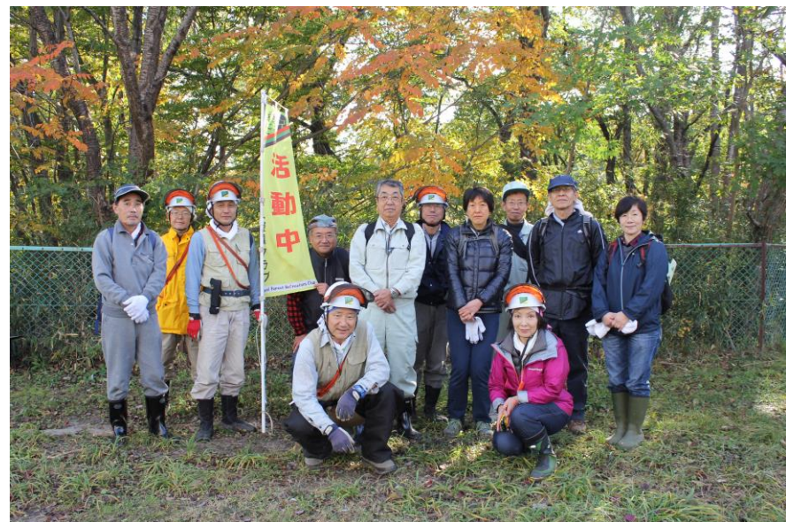
紅葉の中無事に終了