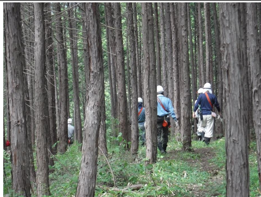
各自スリングをタスキに現場に向かう