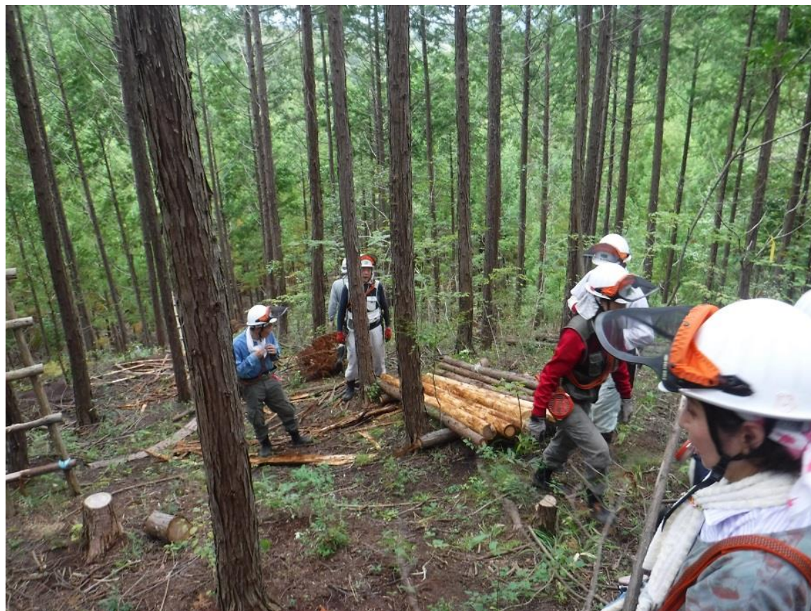
直置きしないように並べる

9月4日(日)の整備活動は、2月に間伐したヒノキの皮むきです。5月頃に集材を予定していましたが、都合でまだできていません。腐れから防ぐため応急対策として皮むきをしました。予想どおりすでに虫が進入していました。