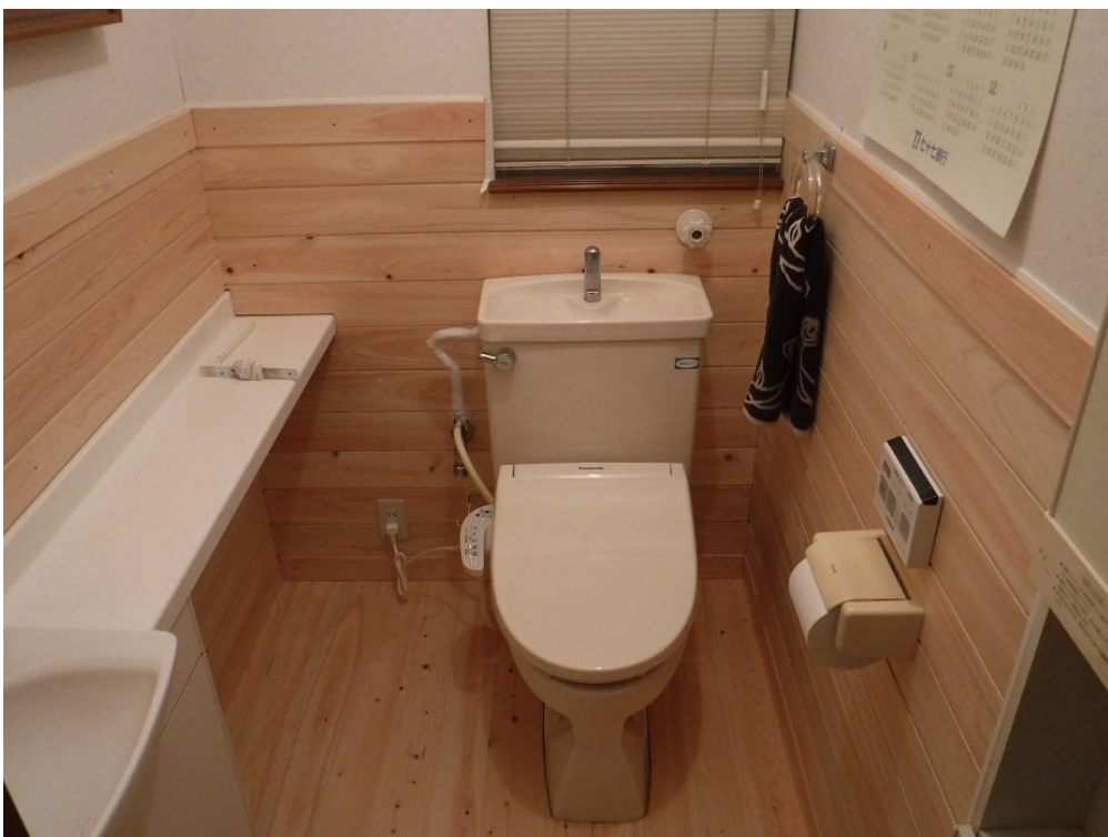
改修完了です。配管の貫通部も悩みました。

改装工事もいよいよ終盤のトイレに掛かります。 便器を外すか、残すかで悩みましたが、後悔しない為に外すことにしました。大がかりな工事になります。 外してみると、夏場の結露の湿気で床が傷んでいました。 ここは床を剥ぐことにしました。 問題は据付直しです。精密に冷静にと非常に神経を使います。 業者に任せる方が正解です。でも、何とか無事に据付。何度も試運転して確認しました。