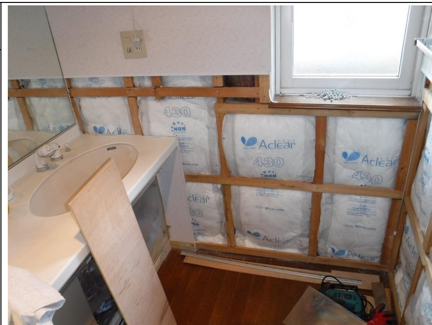
施工中。断熱材を追加したところです。合計 200mmになります