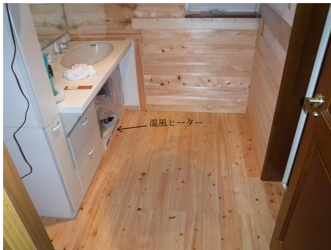
壁の一部を残してほぼ完成。足元温風ヒーターもかさ上げ、洗面台の扉は外しています。