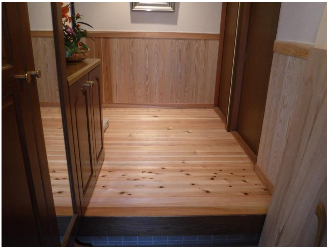
玄関部分です。模様がそろわないのがミソ。上り框はケヤキを使用しました。

出入り部は、「出」の納めが大変です。パズルを解くように神経使います。ドアの枠のカットもたくさん。もういい加減楽にしようと叫びたくなるのをじっと我慢。