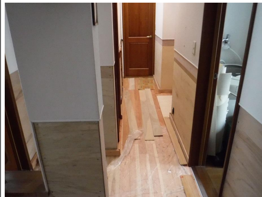
床施工後、壁はこれからです。