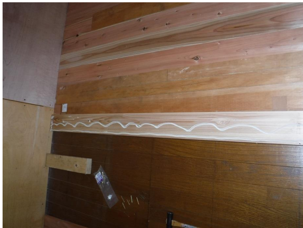
釘留めと接着剤を併用しました

床張り順調に進んでいます。 張り始めの難関を乗り越え、いよいよ本格的に床張りに入りました。 このころには床板の分別もある程度済ませましたが、1床面すべて統一することは出来ず、混在は逃れられませんでした。 購入時の品質を上げれば苦労しませんが、その分コストに跳ね返って来ます。妥協の結果です。