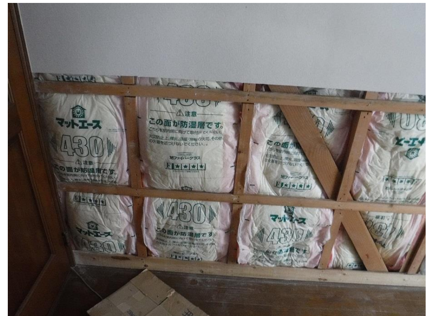
断熱材を（100+50）mm追加しました