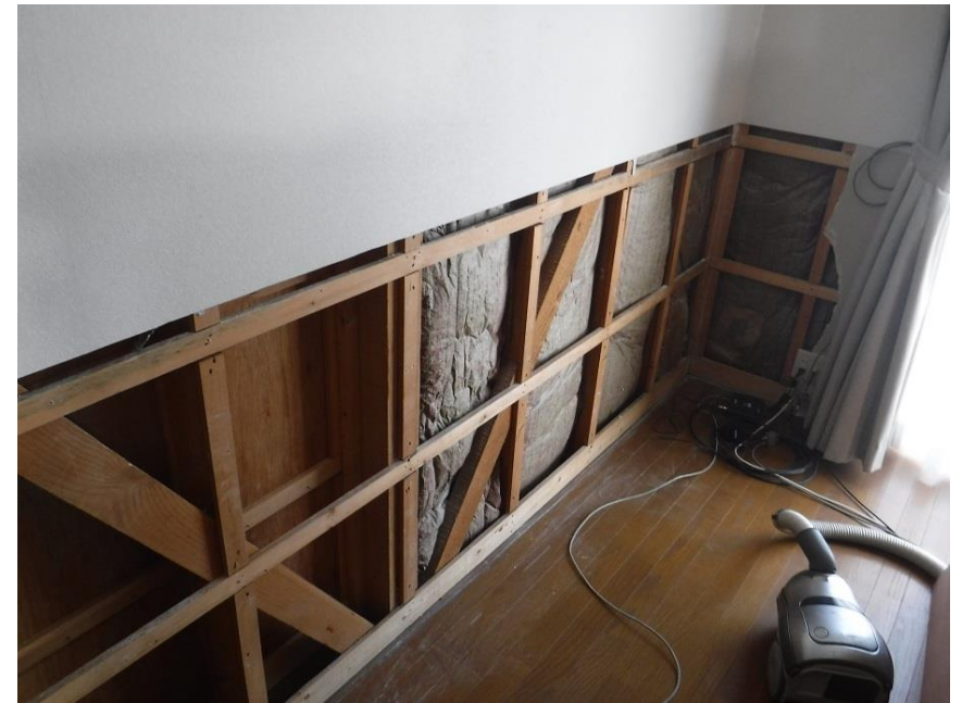
壁の石膏ボードを剥がしました。間仕切り壁には断熱材が入っていません。これでは床下から冷気が上がって来ます。床下は外気です。