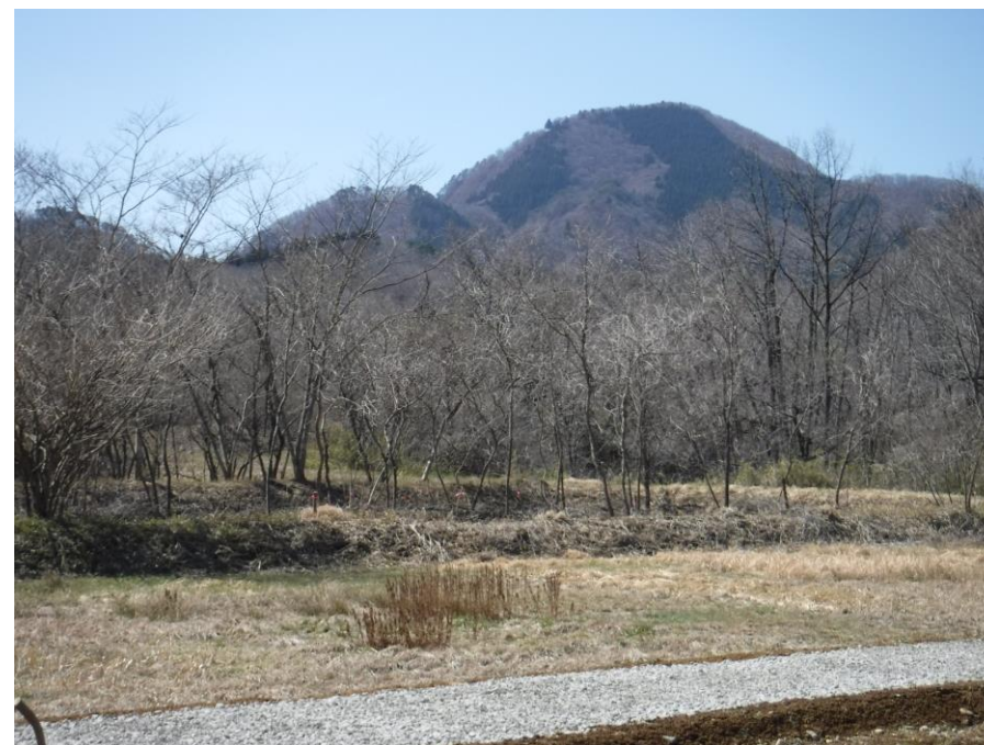
フィールドから望む七ツ森の一つ笹倉山