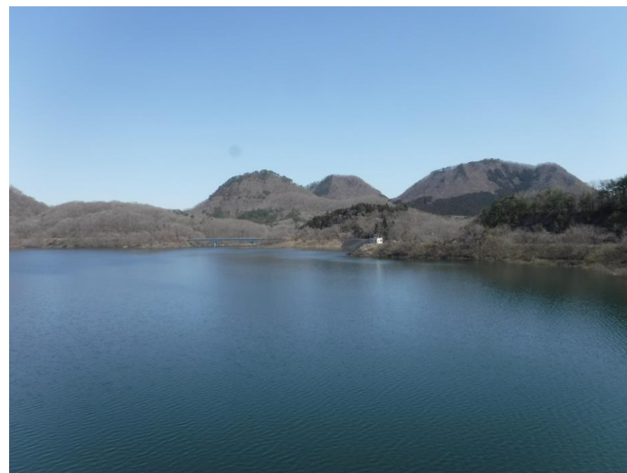
近くの南川ダムから望む七ツ森の蜂倉、大倉、撫倉の3座