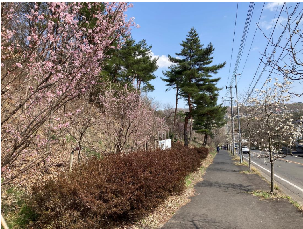
まずまずの咲き具合で一安心

植栽場所の土壌層が薄く、倒れやすいので低く剪定してます。東北高校の土地ですが楽しみながらきれいにしています。