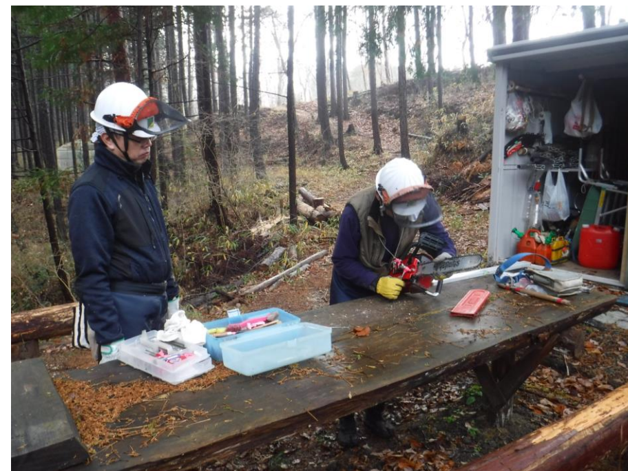
チェーンソーの分解掃除の繰り返し確認