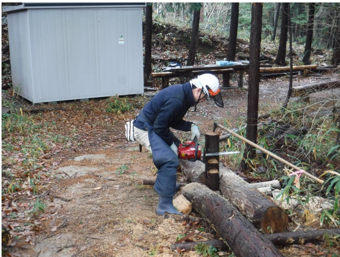
受け口づくりにはかまらず集中力が大事

参加者の少ない活動日は、ゆっくり時間が使えますので、通例ではできなかった活動も、参加者の希望で取り入れます。この日は間伐に備えて伐倒技術の習得、先ずは正確な受け口づくりを練習しました。納得のいくまで何回でも練習ができます。参加者が多い場合はせいぜい1, 2回しか練習できませんのでとてもラッキーです。また、マンツーマンできめ細かく指導が受けられます。