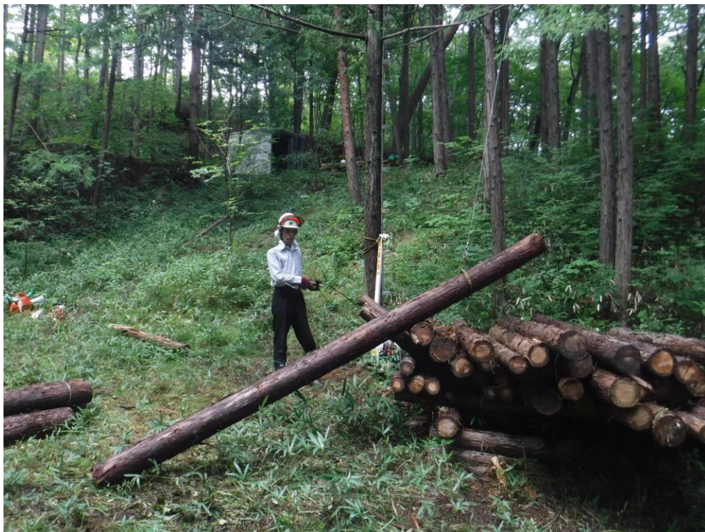
引っ張りだこではい積み

今回は良材だけ集材することにして、なおかつ林道に引き上げるのは止め、下方に引き下ろしにしたところ、4回の作業で集積まで終了。ヒッパリダコ大活躍です。修羅のポチの出番がなく残念。