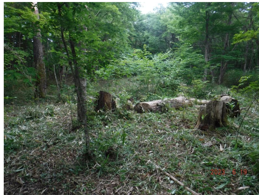
伐倒した枯れ松の残骸が現れる