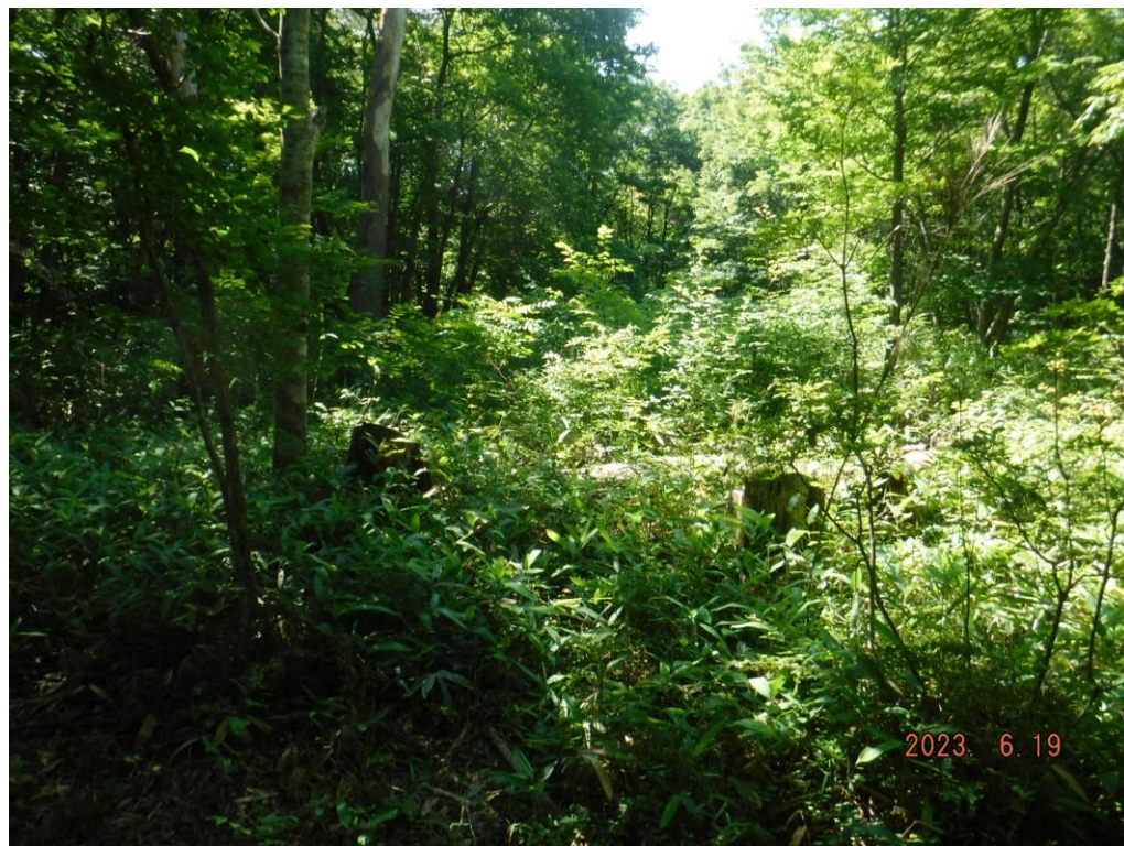
これでは危なくて歩けませんね

改めて入林してみると藪が幅を利かせていました。今後3年間集中して刈払いや遊歩道整備を行い、西地区にまけない林相に持っていきます。体力勝負です。