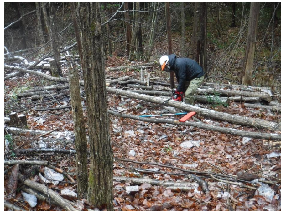
基本的な玉切りの研修を兼ねて