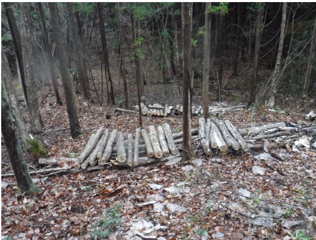
除伐木を活用して切り出した原木だが、芯が黒いね、すでに雑菌か？

原木によるキノコの栽培実験を数年重ねていますが、どうもうまくいきません。自信を持って送り出した最新の方は、雑菌が勝って、失敗作の様です。最初に指導を受けたときに楢木に土を付けないよう厳しく言われましたが、改めて肝に銘じました。今回は植菌の時期を早めるため前倒して楢木となる原木を切り出しました。種菌購入の出資者代表3名が取り組みました。