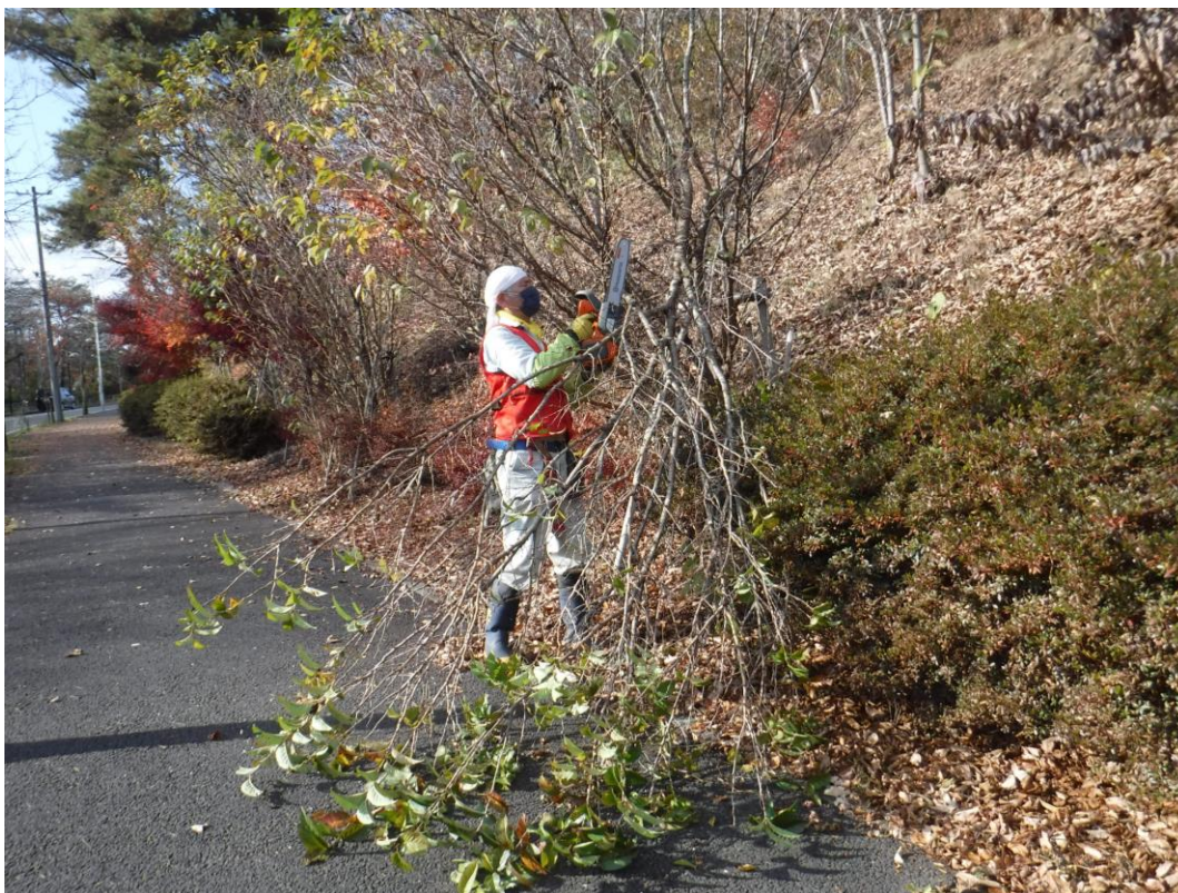
もったいない思いもあるが、思い切りが大事です

力強く伸びてる幹を切るのは、まっこと忍びませんが、背に腹は替えられません。山形の桜生産者に習ったつもりですが、しょせん素人。育ってくれー。来春には結果が？