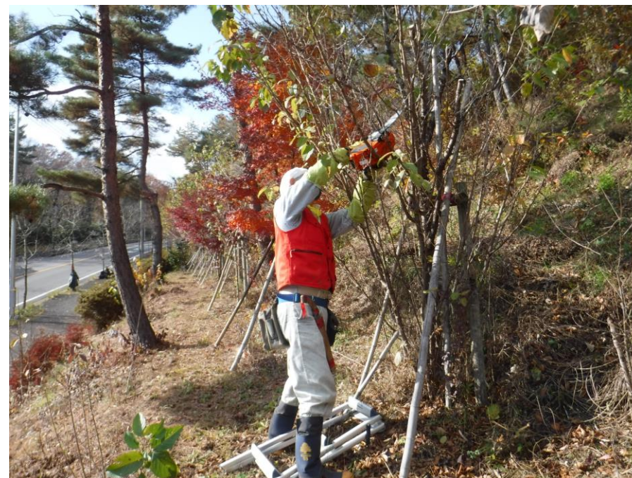
紅葉の中での作業